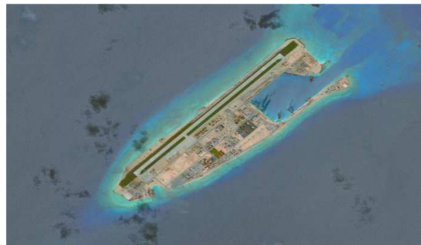
Image n°1 : L'exemple d'une poldérisation d'un « objet maritime » : Fiery Cross dans les Spratleys 67